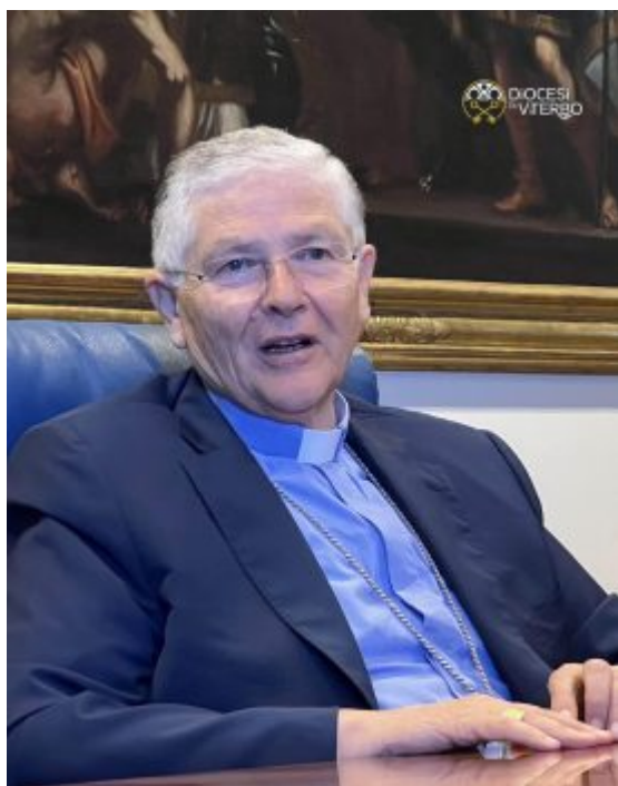
Conferenza Episcopale Laziale

Ufficio Regionale per le Comunicazioni Sociali